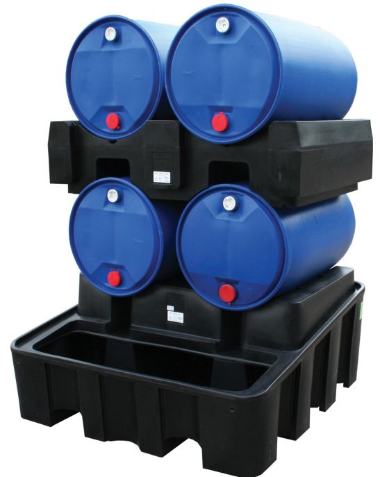
SJ-200-001 + SJ-200-004

Dispensador fácil a usar con cubeto incorporado y soporte bidones • Fabricado en polietileno (PE) 100% reciclable, resistente a la acción de ácidos y bases • Ideal para el dosificación y el almacenaje de 2 o 4 bidones en total • Por usar con la mayoría de carretillas elevadoras • El soporte es para usar sólo con el dispensador • Quite los bidones antes de utilizar una carretilla elevadora.