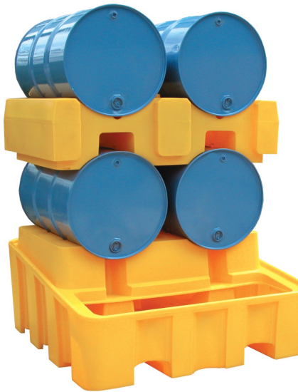
SJ-200-002 + SJ-200-003